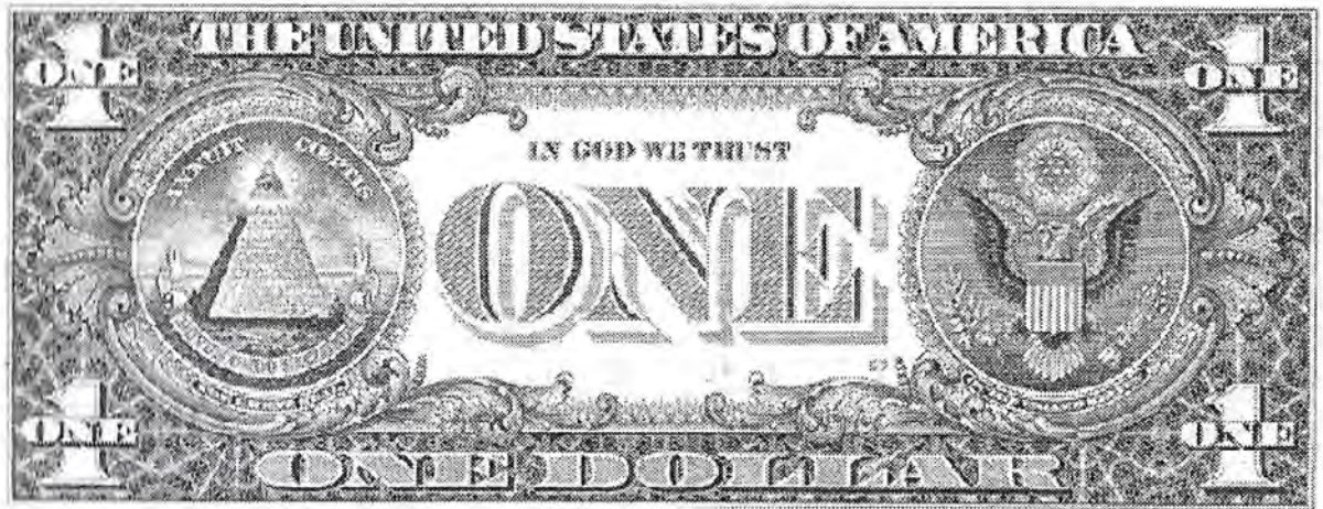
Afbeelding 2. Dollarbiljet met rechts het Grootzegel van de Verenigde Staten

Officieel wordt de arend met de kop naar rechts afgebeeld en zijn de pijlenbundel en olijftak ook van klauw gewisseld.