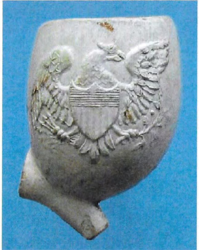
Pijpje met George Washington en het grootzegel van de VS. Zie pagina 2262