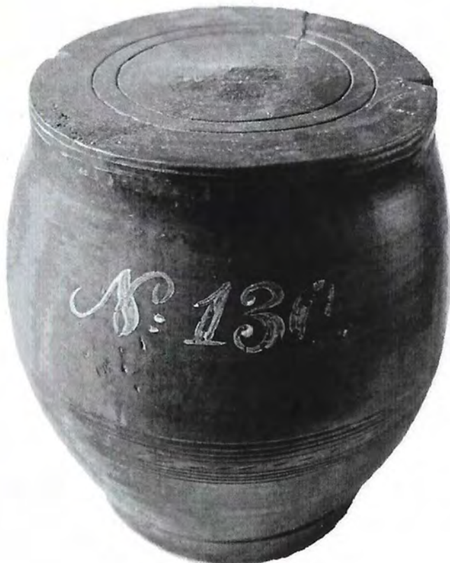
Ta bakstonnetje? Zie pagina 2279