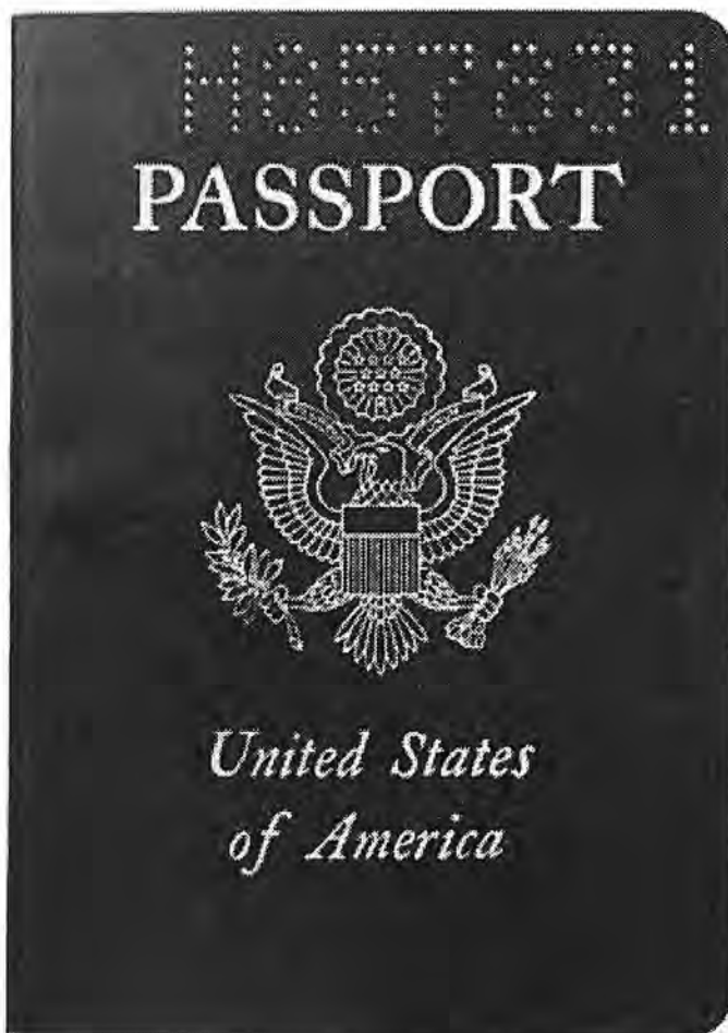
Afbeelding 3. Een paspoort uit de Verenigde Staten

Het Grootzegel wordt gebruikt op officiële documenten van de federale overheid. Ook zien we dit terug op paspoorten uit de VS en dollarbiljetten enz. De arend wordt begeleid door een tekstlint met de Latijnse spreuk E PLURIBUS UNUM wat "uit velen één" betekent. Deze spreuk is sinds 1776 het nationale motto van de Verenigde Staten. De spreuk is op de pijp weggelaten. Het Grootzegel is in 1782 in gebruik genomen.